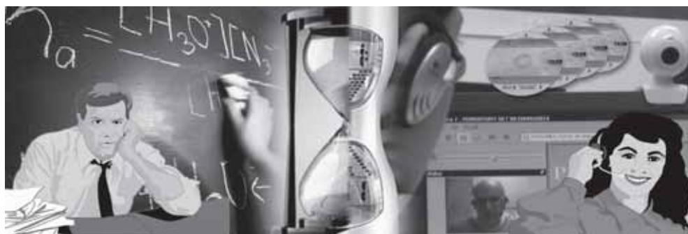
Figura 2.- El antes y el ahora de la Enseñanza

El sistema UVICOA de la Armada está diseñado para poder alcanzar estos dos objetivos: facilita el aprendizaje de su personal y contribuye a mejorar la calidad de la Enseñanza Naval, al dar flexibilidad a los alumnos para participar en los cursos y al estandarizar la enseñanza.